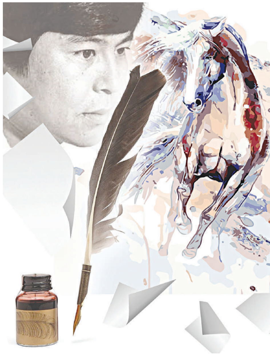
Каламашы жасаған: Әрмен СМІГҮЛ, «ЕҒ»

Ақын ұлт тағдыры, адам, дәуір және қоғам жөніндегі жан тебіреністерін жыраулық дәстүр негізінде толғап, халықтық, ежелгі түркілік сарынның тамырына қан жүгіртті. Дәлірегі, жыраулық үрдіске жаңаша үкі тағып, түркілік сарынның түндігін ашты да, ата-бабаларымыздың елдік мұратын ұқтырып, ұлттық рухын оятты. Сонымен қатар ақын тек өткен шақтың ойпаңы мен өріне ат шалдырып қоймай, бүгінгі қоғамның жықпыл-жықпылына үңіліп, ондағы жағымсыз көріністер мен келеңсіз жағдаяттардың, қалпына келтіру қиын зардаптардың пығу тегі отарлау саясатынан, кеңестік