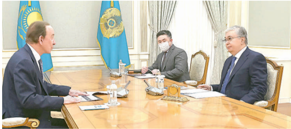
Мемлекет басшысы Қасым-Жомарт Тоқаев «Air Astana» президенті Питер Фостерді қабылдады.

Қабылдау кезінде «Air Astana» басшысы Мемлекет басшысына әуе компаниясының 2022 жылғы операциялық және қаржылық көрсеткіштері жөнінде мәлімет берді. Сондай-ақ компанияның 2023-2027 жылдарға арналған жоспары туралы баяндады.