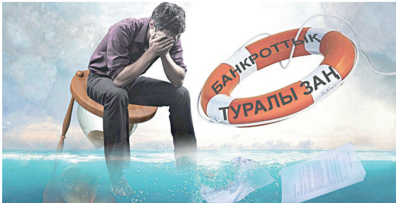
Коллажты жасаған: Аманжол ҚИЯС, «EQ»